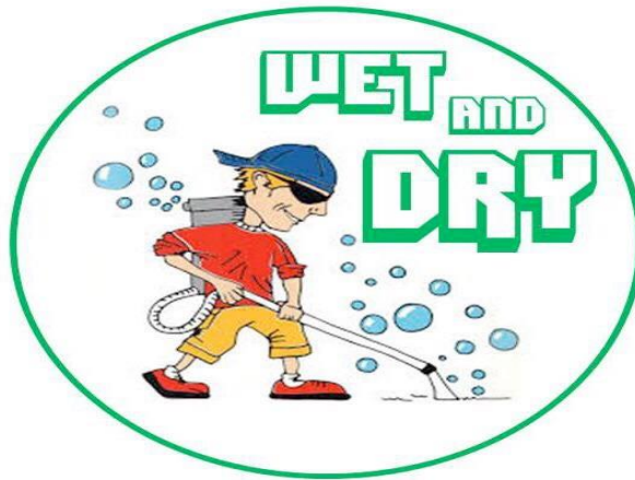
Gambar 2.1 Usaha Jasa Sedot Debu dan Tungau Wet and Dry Logo

Gambar 2.1 merupakan logo dari Usaha Jasa Sedot Debu dan Tungau Wet and Dry yang terdiri dari 2 unsur yaitu nama perusahaan, serta logo usaha. Ide nama Usaha Jasa Sedot debu dan Tungau Wet and Dry datang dari keinginan penulis untuk memberikan jasa vacuum. Sebagian masyarakat mengetahui bahwa vacuum itu hanya berfungsi untuk menyedot debu kering saja. Tetapi karena zaman juga sudah berubah dan semakin berkembang, kali ini sudah hadir alat vacuum yang juga guna untuk menyedot bagian-bagian rumah yang basah. Misalnya kasur atau karpet yang basah dikarenakan terkena air kencing anak kecil.