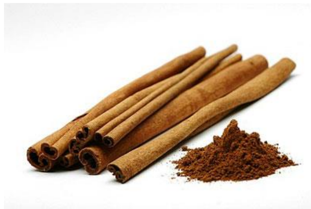
Gambar 1.2 Kayu Allure Bahan Baku Kayu Manis

Penulis menggunakan produk kayu manis yang memiliki standar ekspor grade A untuk menjamin kualitas dan manfaat dari kayu manis tersebut. Untuk produk kopi, penulis menggunakan jenis kopi 50% kopi Robusta dan 50% kopi Arabica bubuk.