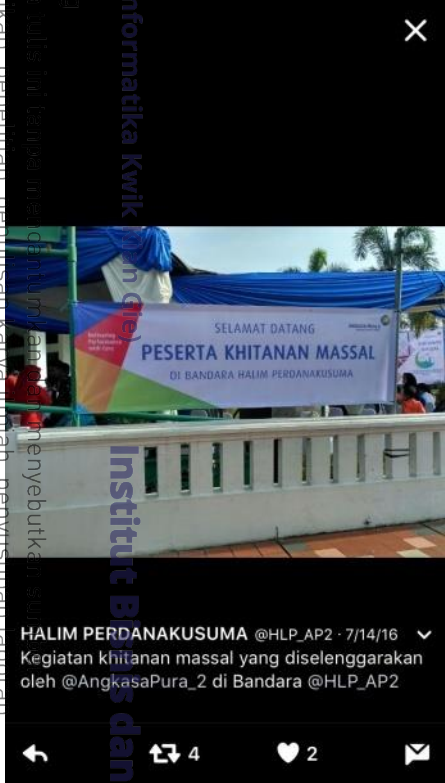
HALIM PERDANAKUSUMA @HLP_AP2 · 7/14/16 Kegiatan khitanan massal yang diselenggarakan oleh @AngkasaPura_2 di Bandara @HLP_AP2