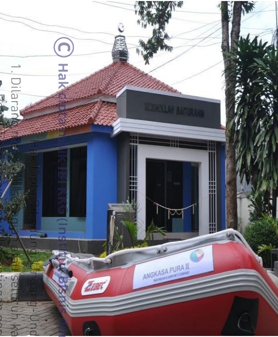
1. Dilarang menyalin, mengutip, atau menjiplak seluruh atau sebagian karya tulis ini tanpa mencantumkan nama penulis dan institusi asal. Hak Cipta Dilindungi Undang-Undang

Hak Cipta Dilindungi Undang-Undang Institusi Kritis dan Informatika Kwik Kian Gie