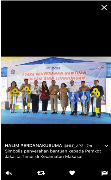
HALIM PERDANAKUSUMA @HLP_AP2 · 7m Simbolis penyerahan bantuan kepada Pemkot Jakarta Timur di Kecamatan Makasar