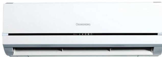
Contoh AC Keripik Pisang Tepung De'Iis

AC digunakan agar konsumen yang datang dapat menunggu dan berbelanja dengan nyaman.