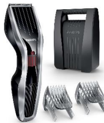
Hair Clipper Philips HC 3426