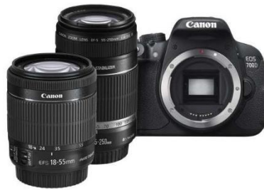
Canon EOS 700D Double lens