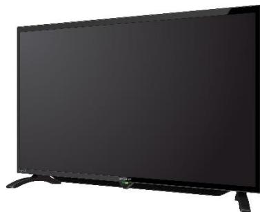
Sharp 32" LED TV LC-32LE 180l 32LE180