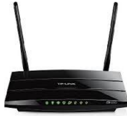
TP-LINK TD-28970 Wifi Router