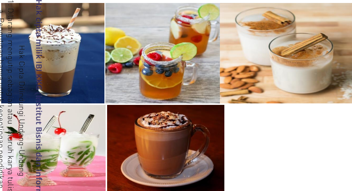
(Hazelnut Latte, Royal Jasmin Tea, Horchata, Cendol Original, Hot Cappucino)

Hak Cipta Dilindungi Undang-Undang Institut Bisnis dan Informatika Kwik Kian Gie Institut Bisnis dan Informatika Kwik Kian Gie