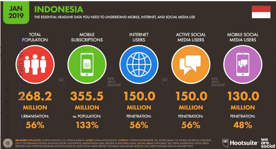
Gambar 1.2 Data Total Pengguna Mobile, Internet, dan Social Media

Salah satu media sharing adalah YouTube. YouTube adalah media sosial yang digunakan untuk berbagi video. Dalam YouTube itu sendiri memiliki beberapa konten, seperti tutorial, cover music , gaming , challenge , social experiment , tips-tips, bahkan konten memasak seperti membagikan resep dan mempraktekkan cara masaknya. Bagi orang-orang yang mempunyai hobi unik, hobi yang bisa menguntungkan pun bisa dibagikan di YouTube. Kemunculan YouTube sendiri ada negatif dan positifnya. Negatifnya, banyak yang menjadikan YouTube sebagai alat untuk pamer dan memperlihatkan eksistensinya serta digunakan untuk penyebaran provokasi dan juga SARA. Namun dibalik itu semua terdapat hal positif juga, seperti di dalam YouTube terdapat video yang bisa kita akses untuk belajar dan mencoba pengalaman serta mengasah kemampuan. Dari data yang peneliti dapat YouTube merupakan sosial media yang paling sering digunakan.