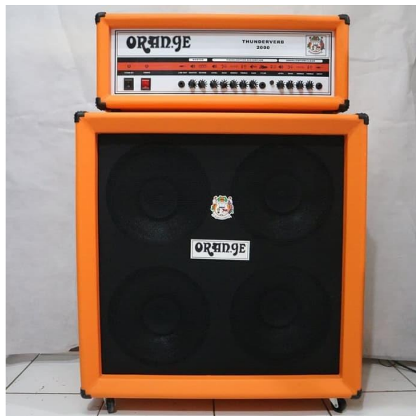
Contoh Amplifire Braja Record's