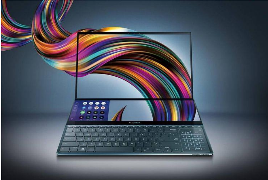
Contoh Laptop Braja Record's

Laptop ASUS Transformer Flip TP510UA merupakan salah satu perangkat pendukung yang digunakan oleh Braja Record's untuk memberikan hasil rekaman kepada pelanggan dan juga digunakan sebagai administrasi kantor Braja Record's.