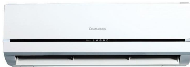
Contoh AC Braja Record's

AC digunakan agar pelanggan yang datang dapat menunggu dan karyawan