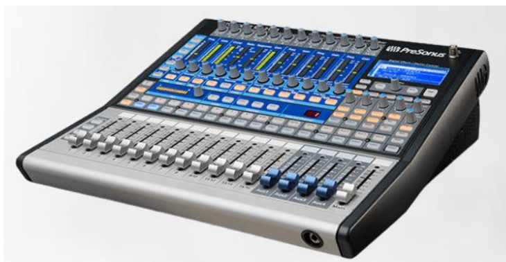
Contoh Mixer Yang Dipakai