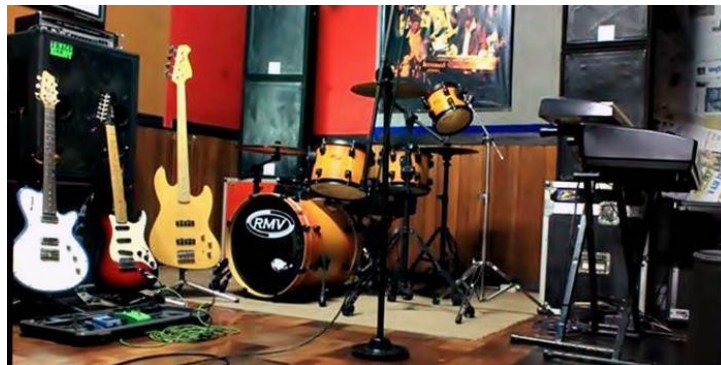
Contoh Alat-Alat Musik Braja Record's

Alat-alat musik sebagai inti dari proses rekaman berfungsi untuk memainkan atau membawakan susunan nada-nada dalam sebuah lagu.