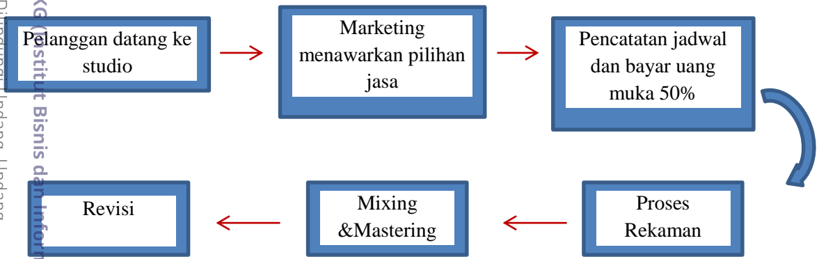
Gambar 5.2 Alur Produk Braja Record's

produk ini dapat digunakan sebagai standar dalam melayani konsumen. Berikut adalah alur produk Braja Record's yang dapat dilihat pada gambar 5.2