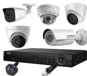
Contoh CCTV Braja Record's