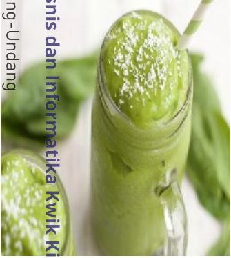
Smoothies Green Tea