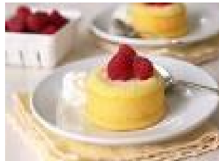
Vanilla Chees Lava Cake