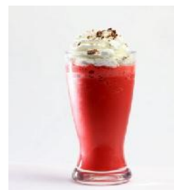
Smoothies Red Velvet