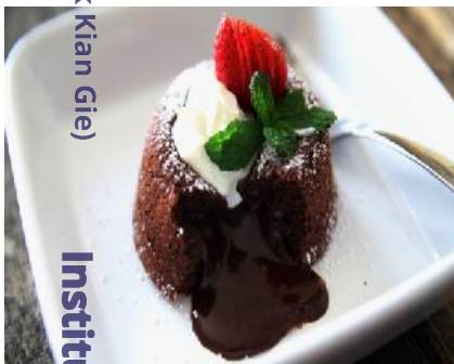
Choco Lava Cake