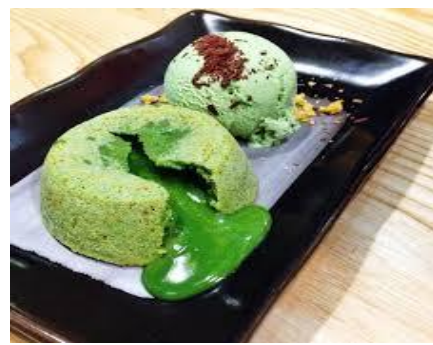
Green Tea Lava Cake

Hak Cipta Milik PT BIKS (Institut Bisnis dan Informatika Kwik Kian Gie) Hak Cipta Dilindungi Undang-Undang