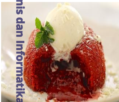
Red Velvet Lava Cake