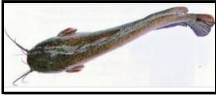
Gambar Bibit Ikan Lele Sangkuriang