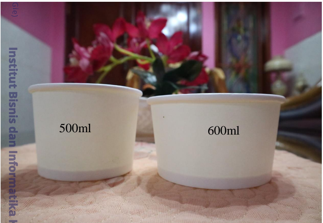
Lampiran 6 Cup CEK.CUP

Institut Bisnis dan Informatika Kwik Kian Gie