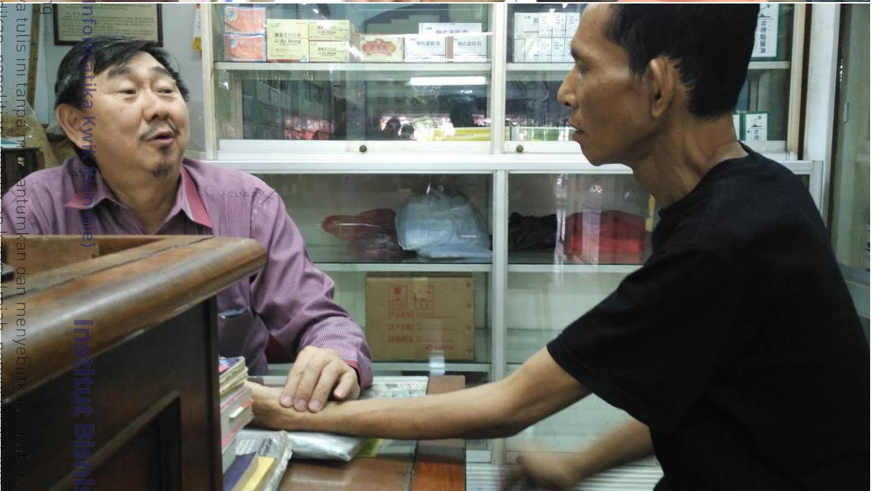
Institut Bisnis dan Informatika Kwik Kian