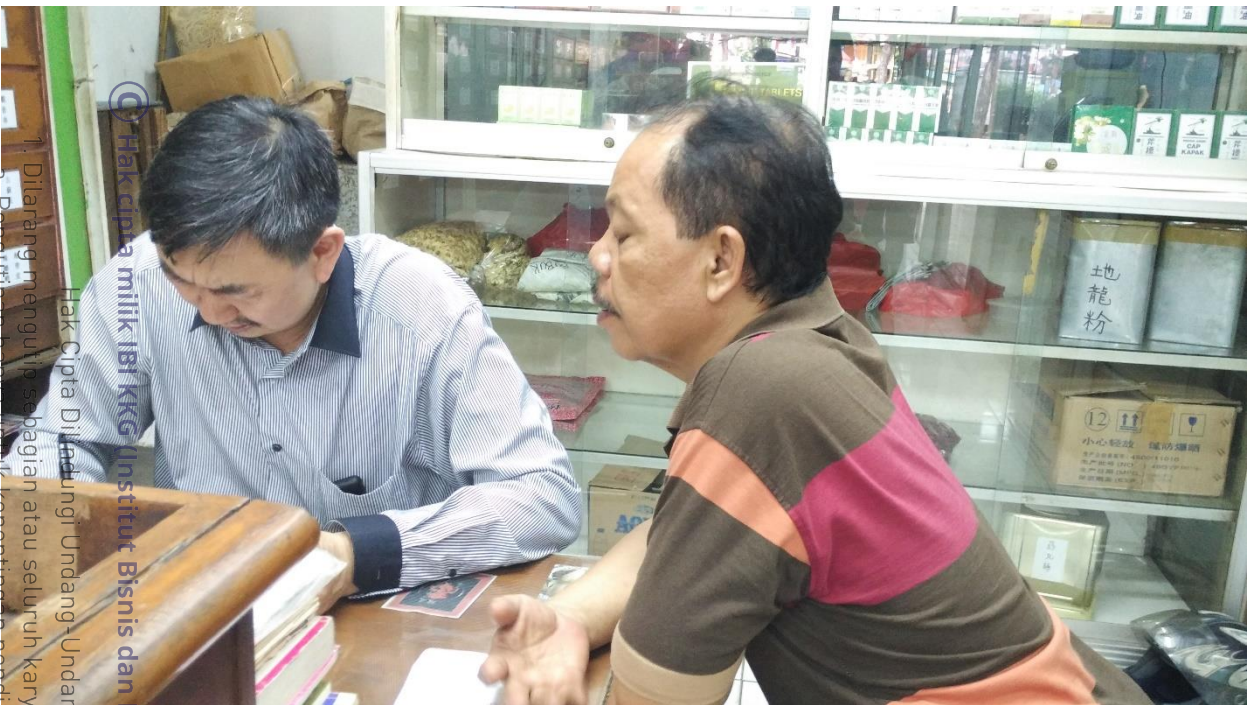
Hak Cipta milik IBI KKG Institut Bisnis dan Informatika Kwik Kian (Kwik Kian)