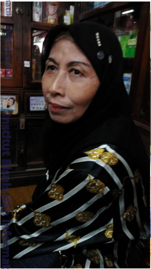
Institute Bisnis dan Informatika Kwik Kian