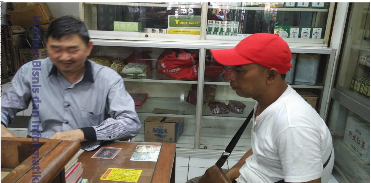
© Hak cipta milik IBIKKG (Institut Bisnis dan Informatika Kwik Kian Gie)