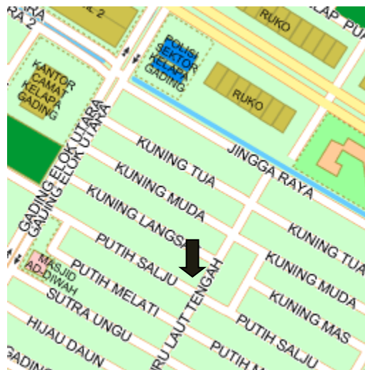
Gambar 4.1 Kelapa Gading Badminton Hall Denah lokasi Kelapa Gading Badminton Hall

Keterangan: Lokasi ditunjukkan oleh panah berwarna hitam