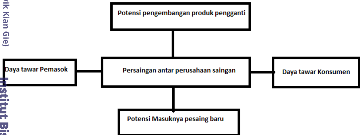
Gambar 2.3 Model Lima Kekuatan Porter

Sumber : Fred R. David. Manajemen Strategis: Konsep. Edisi 12