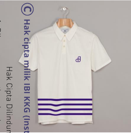
© Hak cipta milik IBI KKG (Institut Bisnis dan Informatika Kwik Kian Gie)