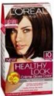
L'Oreal Hair Toning