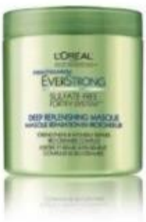
L'Oreal Hair Color