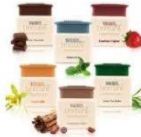
L'Oreal Hair Spa