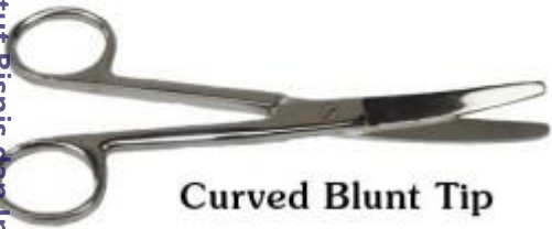
Curved Blunt Tip