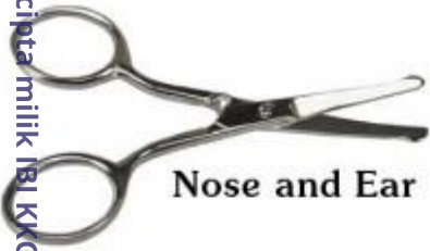
Nose and Ear