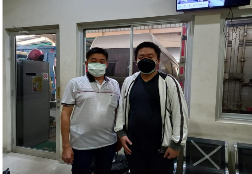
Gambar 5.1 Pemilik dan Penulis