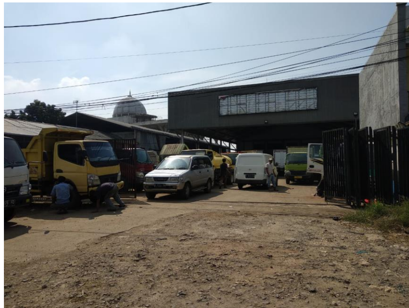
Gambar 5.4 Showroom Mobil Cabang Bekasi