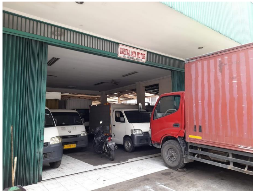
Gambar 5.2 Gerbang Depan Showroom PT. Taruna Jaya Motor