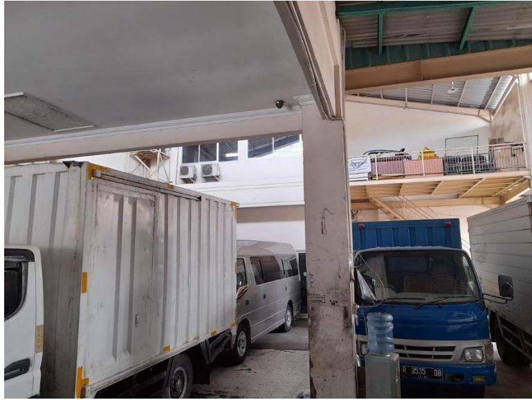
Gambar 5.3 Dalam Showroom Mobil PT. Taruna Jaya Motor