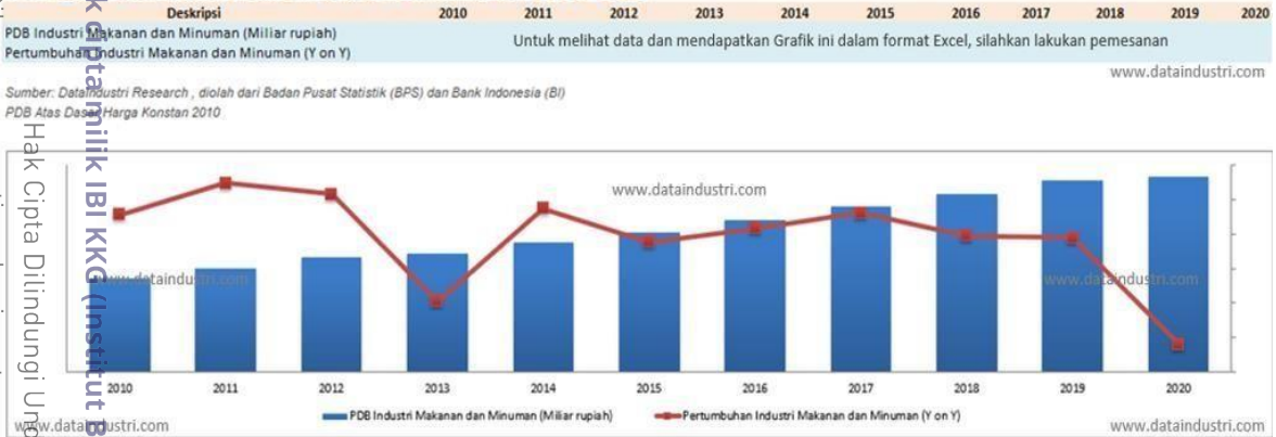
Tren Data Pertumbuhan Industri Makanan dan Minuman, 2010 - 2020

Sumber : https://www.dataindustri.com/produk/data-pertumbuhan-industri-makanan-dan-minuman/