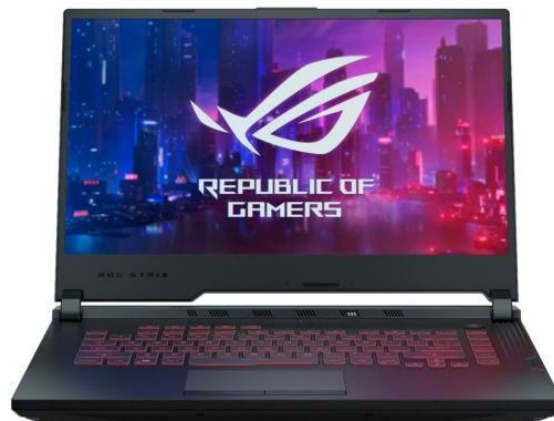
Laptop STRIX III G531GT