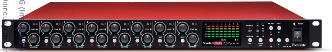
Gambar 5.9 SCARLETT GEN3

Alat ini digunakan untuk menyimpan suara elektronik dan menyaringnya ke dalam computer / software.