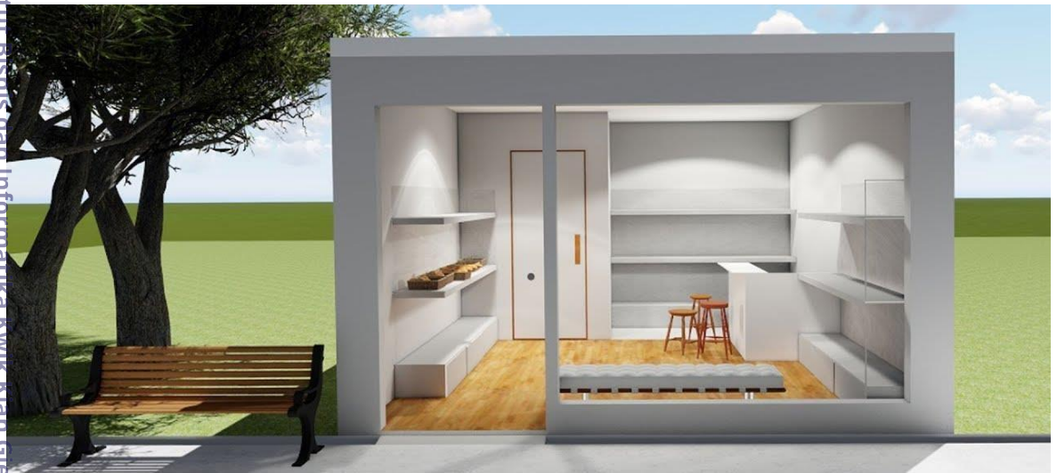
Layout Bangunan Solasi

Gambar pada gambar 5.3 merupakan ilustrasi atau layout bangunan toko Solasi yang akan digunakan dengan ukuran bangunan yaitu, 4 x 6m.