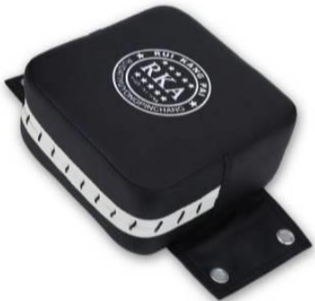
Pad Wall Target