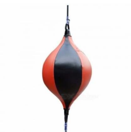
Double End Speed Ball