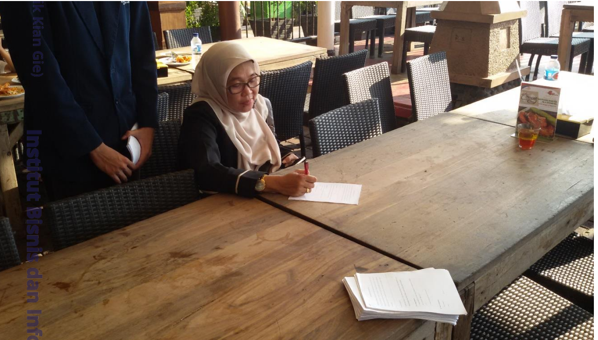
Institut Bisnis dan Informatika Kwik Kian Gie