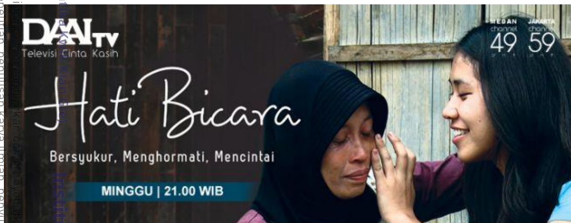
Gambar Program Acara Reality Show “Hati Bicara” DAAI TV

Berikut adalah gambar dari program acara reality show “Hati Bicara” DAAI TV yang dijadikan penulis sebagai bahan penelitian. Program acara reality show “Hati Bicara” DAAI TV merupakan salah satu program acara DAAI TV yang memberikan cermin sosial, budaya dan humanis yang memperlihatkan kehidupan dari dua sisi yang berbeda. Pada program kali ini DAAI TV tidak berbicara tentang kemiskinan ataupun penderitaan seseorang dalam menjalani hidup. Akan tetapi DAAI TV menampilkan narasumber dari keluarga dengan tingkat ekonomi menengah ke atas untuk beraktivitas bersama lingkungan yang ditentukan.