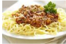
Spaghetti Classic Bolognese