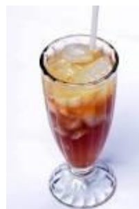
Ice Teh Manis