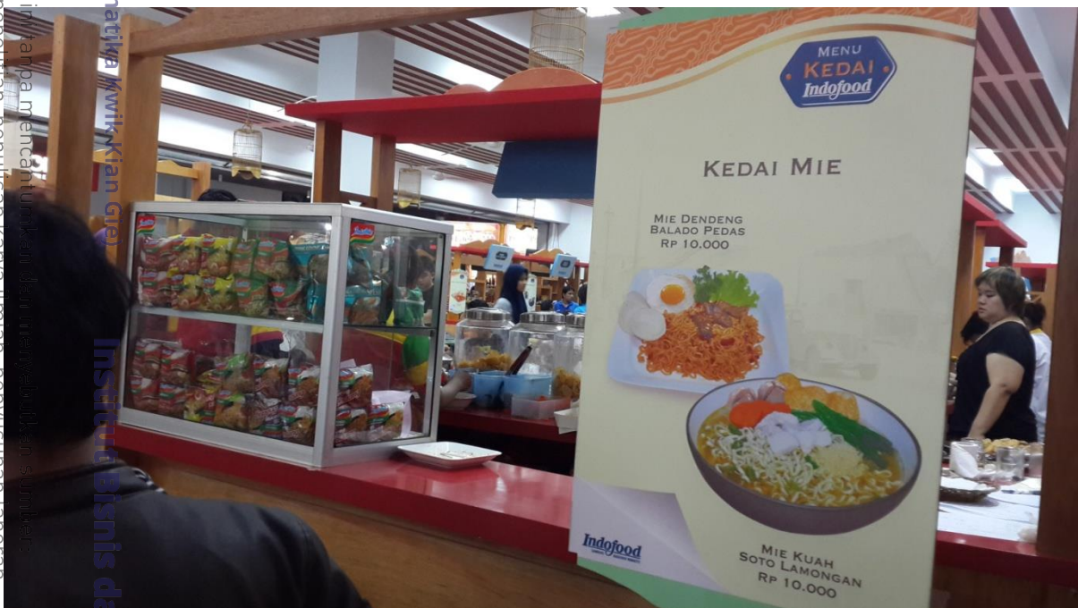
Kedai produk Indomie Pekan Raya Jakarta 2015 yang terletak di bagian depan stand