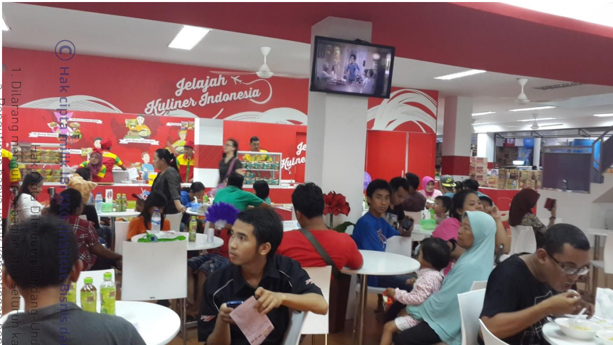
Keramaian pengunjung stand Indomie Pekan Raya Jakarta 2015 yang menjadi sampel penelitian