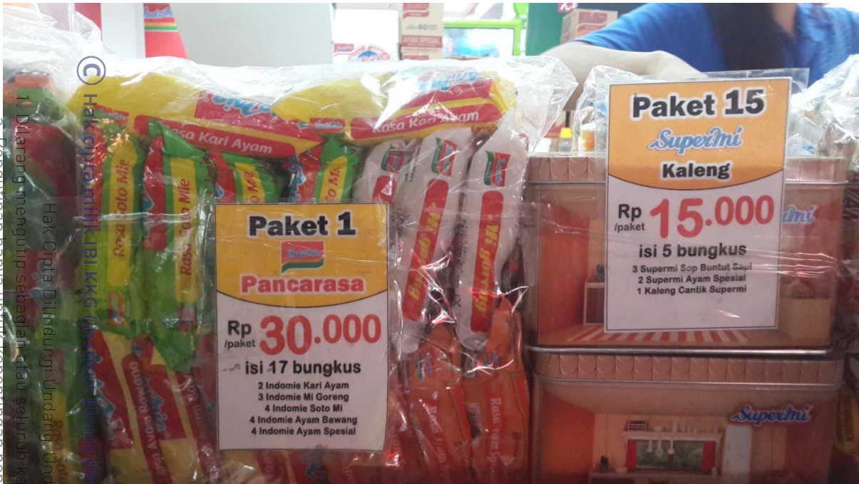
Ragam paket produk Indomie Pekan Raya Jakarta 2015