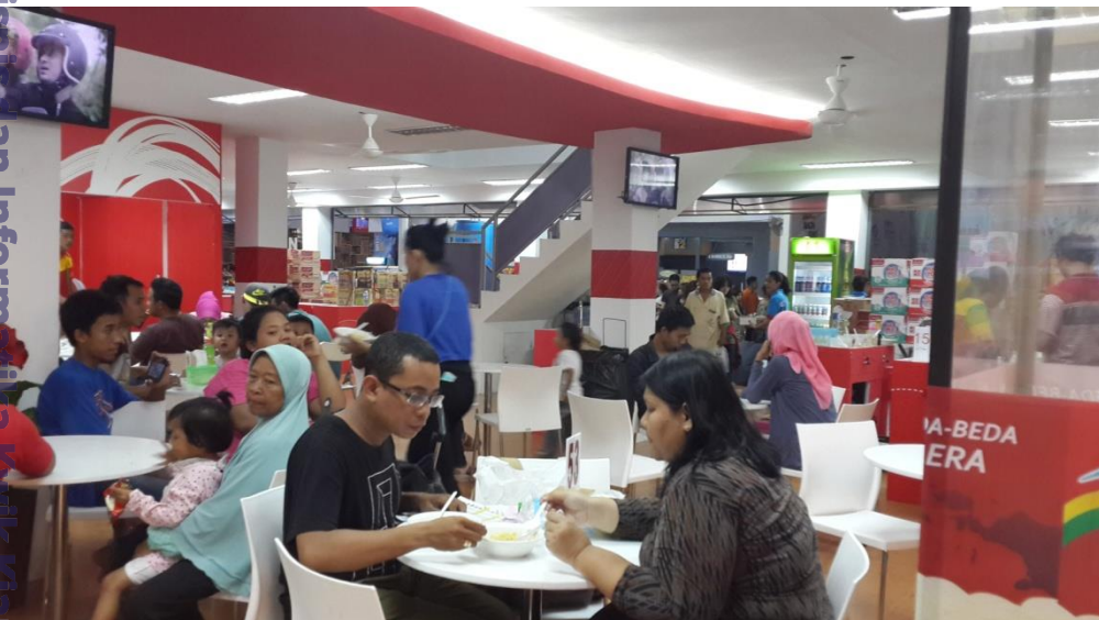
Situasi Stand Indomie Pekan Rava Jakarta 2015