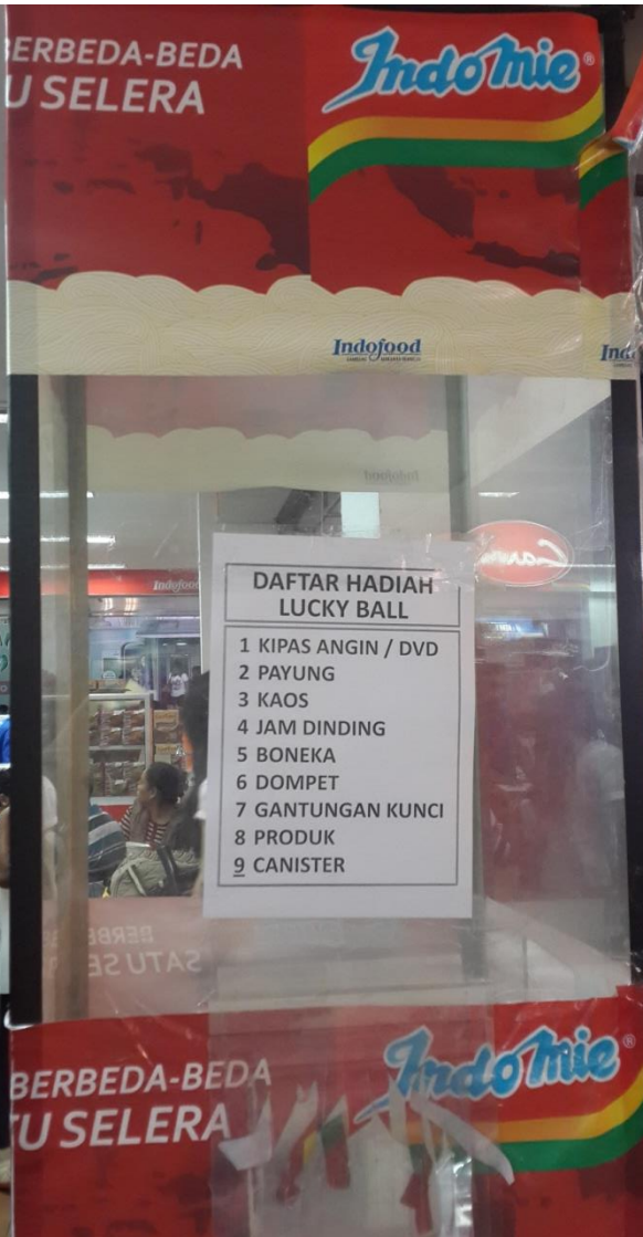
Indomie Luckv Box