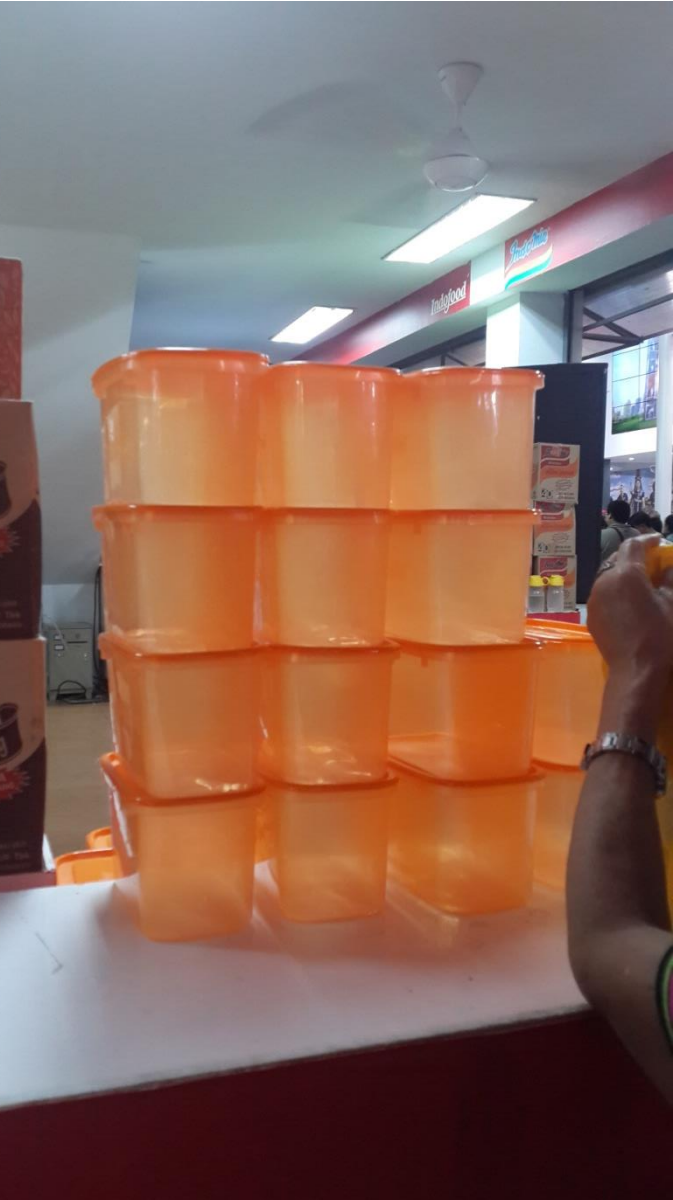
Tupperware yang menjadi hadiah langsung pembelian paket produk Indomie Pekan Raya Jakarta 2015