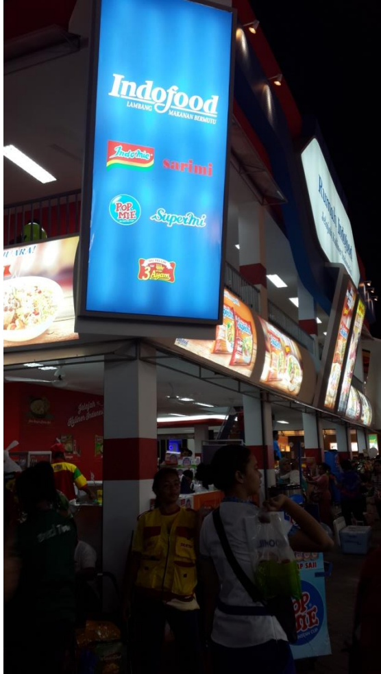
Tampak luar stand Indomie Pekan Raya Jakarta 2015