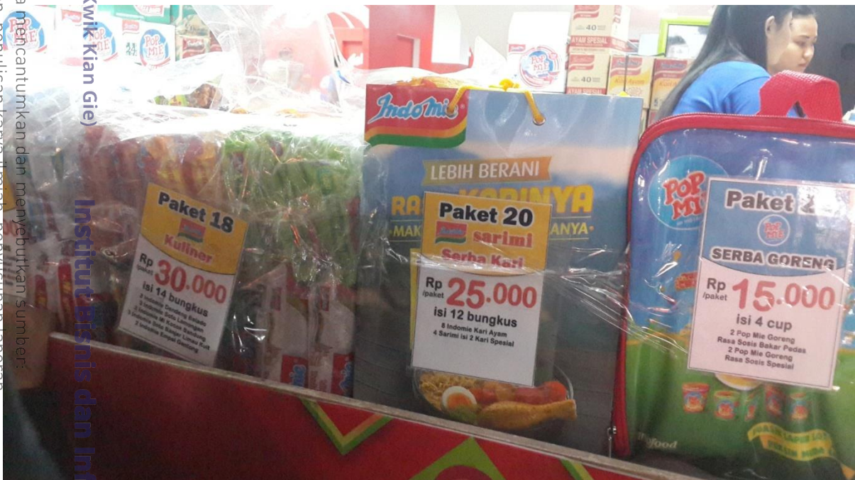
Ragam paket produk Indomie Pekan Raya Jakarta 2015