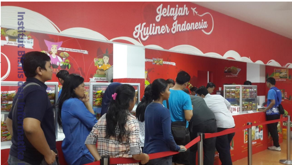
Keramaian antrian stand Indomie Pekan Raya Jakarta 2015