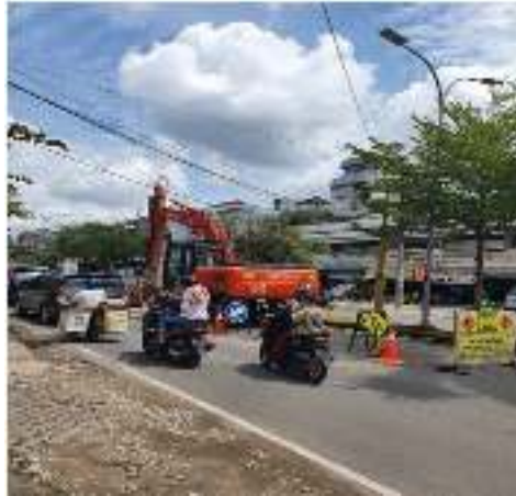
Gambar 1.3 Proyek Penggalian Pipa di Kota Jambi

proyek di kota Jambi, bahkan mesin untuk membuka usaha. Pada saat rencana bisnis ini disusun, terdapat banyak sekali proyek yang sedang dilaksanakan di kota Jambi, yang diantaranya dapat dilihat pada gambar dibawah ini.