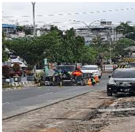
Gambar 1.4 Proyek Perbaikan Jalan di Kota Jambi

Pada gambar tersebut, dapat dilihat bahwa adanya proyek penggalian pipa di kota Jambi, yang dilaksanakan di daerah Talang Banjar, kota Jambi.