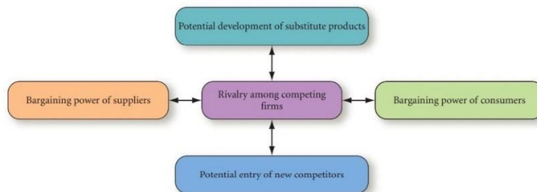
Gambar 3.3 Porter’s Five-Force Model

Sumber: Fred R. David (2017:229), Strategic Management