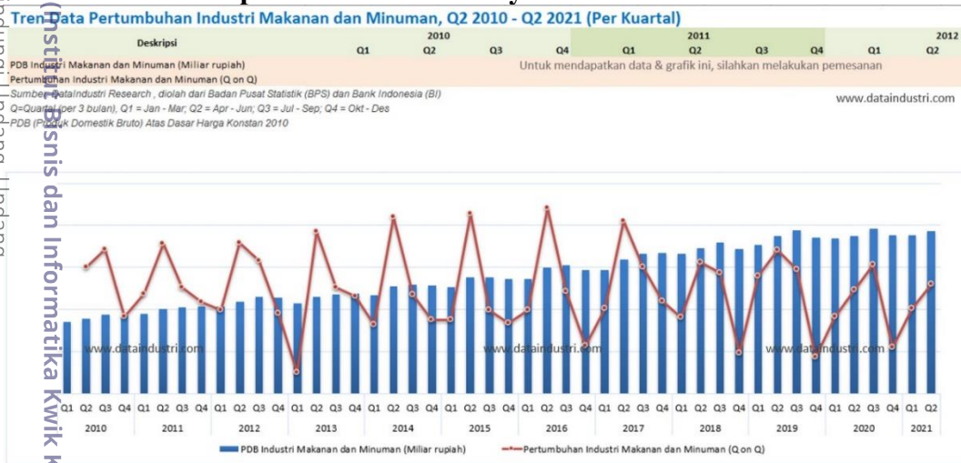
Gambar 3.1 Grafik pertumbuhan industry makanan dan minuman

mingguan atau bulanan dan juga berkat pelanggaran aktifitas ini distributor utama dari Game Pokemon di Indonesia yaitu AKG Games bisa menyelenggarakan acara dengan skala yang lebih besar salah satunya adalah pokemon battlefest asia acara ini merupakan turnamen dengan skala Asia dengan adanya pertandingan kualifikasi didalam negeri.