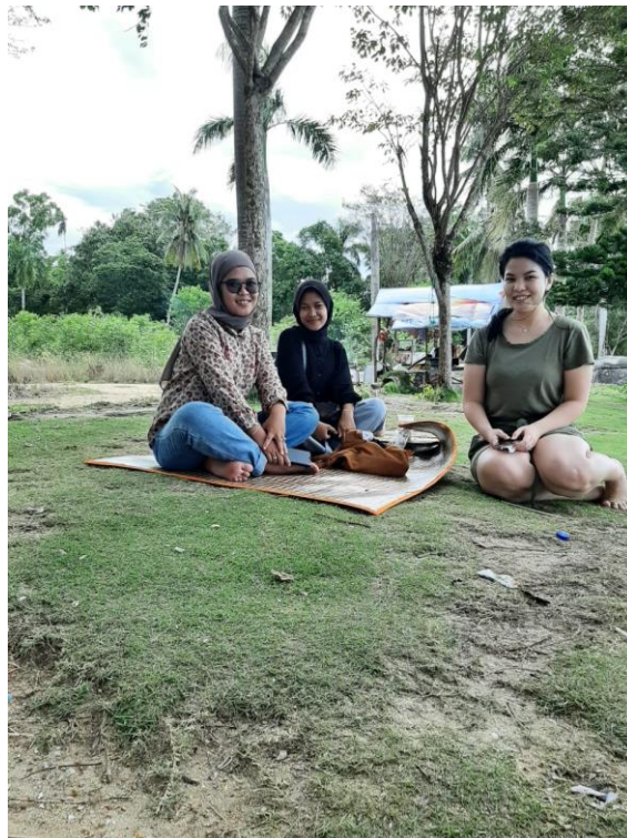
Foto bersama kedua informan yang merupakan wisatawan