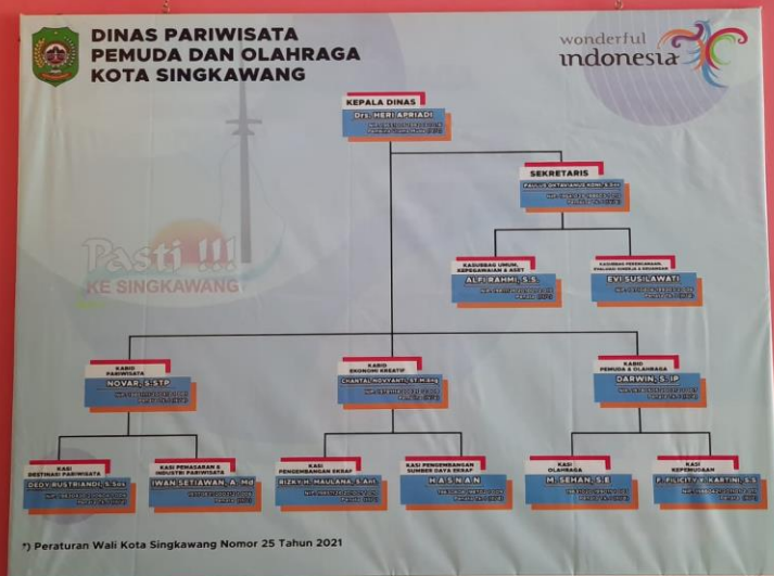
Struktur organisasi Dinas Pariwisata, Pemuda dan olahraga kota Singkawang

© Hak cipta milik IBI KKG (Institut Bisnis dan Informatika Kwik Kian Gie)