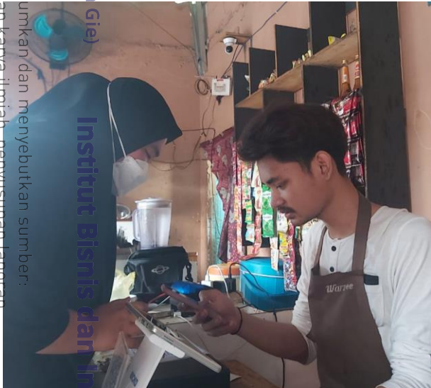
Warkop Lee Muncang