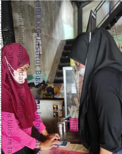
Warkop 2 Lantai

b. Pengutipan tidak merugikan kepentingan yang wajar IBIKKG. 2. Dilarang mengumumkan dan memperbanyak sebagian atau seluruh karya tulis ini dalam bentuk apapun tanpa izin IBIKKG.