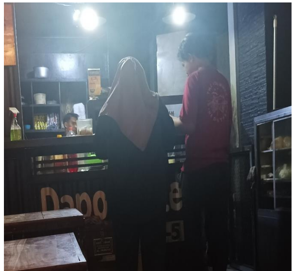
Darkit KQ – 5