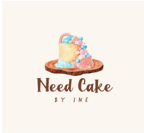
Gambar 1. 2 Logo Usaha Need Cake

Berikut adalah gambar logo usaha dari Need Cake :