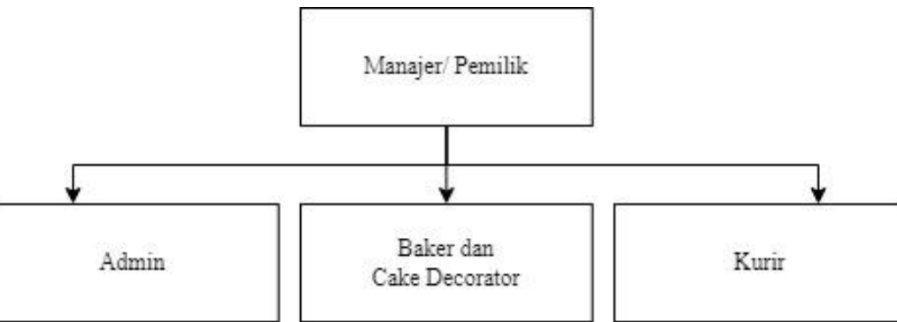
Gambar 6. 2 Struktur Organisasi Keku Bake

struktur organisasi perusahaan untuk dapat membagi dan mengkoordinasikan tugas masing-masing. Ada beberapa jenis struktur organisasi perusahaan yang diantaranya adalah struktur organisasi sederhana, struktur organisasi fungsional dan struktur organisasi divisional. Keku Bake sendiri menggunakan struktur organisasi sederhana karena Keku Bake sendiri merupakan usaha yang tergolong baru dan kecil. Berikut struktur organisasi dari Keku Bake: