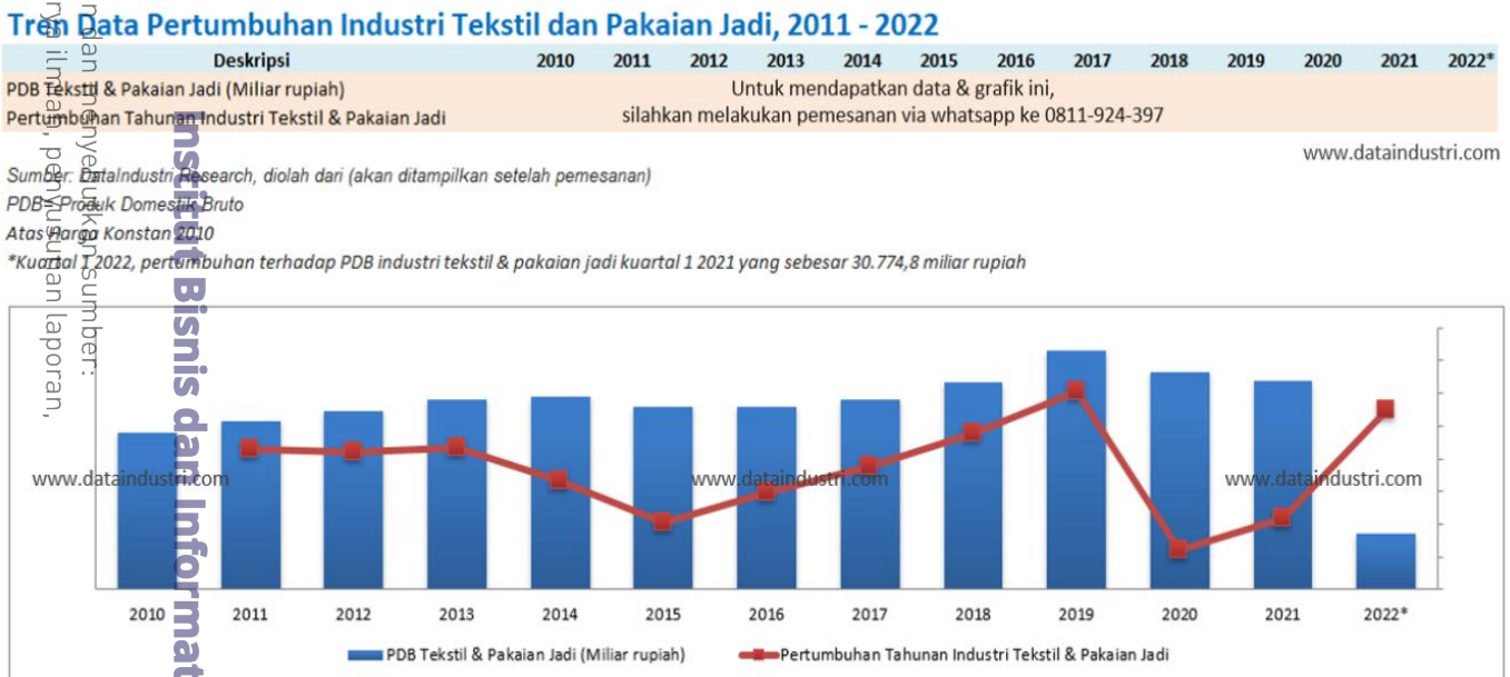
Gambar 3. 1 Grafik Tren Pada Data Pertumbuhan Industri Tekstil dan Pakaian Jadi Tahun 2011 – 2022