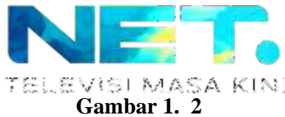
Gambar 1. 2

NET TV sendiri baru berdiri lebih tepatnya pada tahun 2013, pada 23 Mei 2013 dimana NET TV menghadirkan berbagai macam program yang edukatif, menghibur, kreatif, inspiratif dan juga up to date . Berdasarkan data yang diperoleh dari website official NET TV (dapat diakses pada 2018).