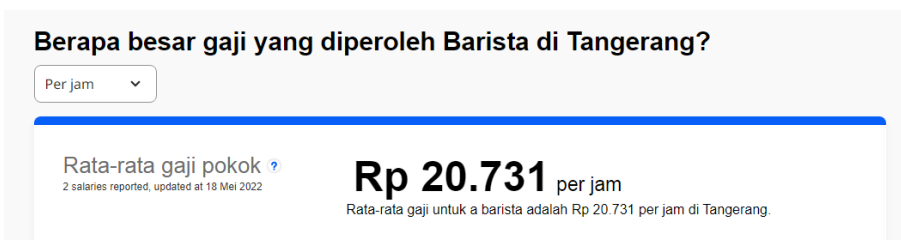
Gambar 6.3 Rata-rata Gaji Barista Part Time di Tangerang