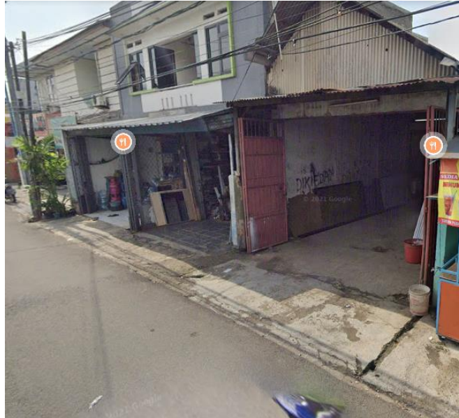
Gambar 3.1 Toko Sumber Berkat Abadi

Sumber Berkat Abadi (SBA) adalah sebuah perusahaan yang bergerak dibidang jasa pembuatan tekuk plat besi yang didirikan pada 28 Maret 2017. Usaha ini didirikan oleh pemilik dengan tujuan untuk memberikan pelayanan yang profesional, cepat, hasil yang presisi, dan akurat untuk ukuran. SBA juga senantiasa meningkatkan standar kualitas produk, reputasi kepada pelanggan, hingga pertumbuhan perusahaan sendiri. Dengan fasilitas moderen dan canggih, didukung area produksi yang cukup luas dan nyaman untuk memudahkan dalam proses produksi. SBA bersedia melayani permintaan pelanggan hingga mendapatkan hasil yang terbaik dan memuaskan untuk Pelanggan.