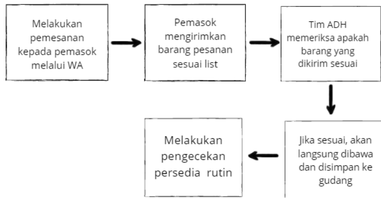
Gambar 5.2 Rencana Alur Pembelian Bahan April Dog House