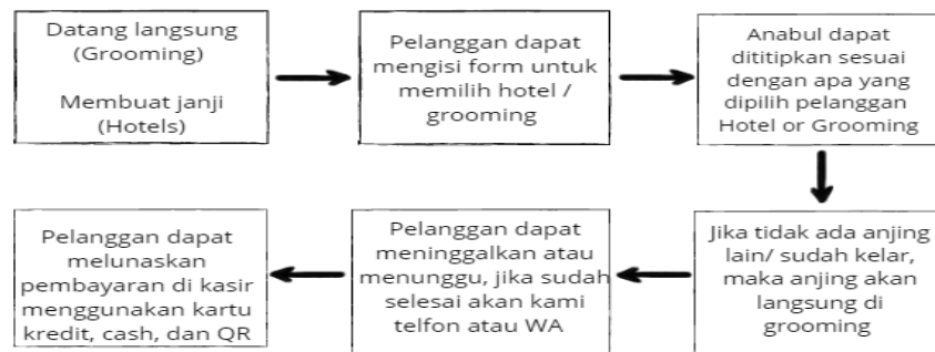
Gambar 5.1 Rencana Alur Jasa April Dog House