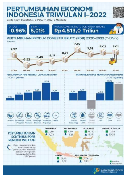
Gambar 1.1 Pertumbuhan Ekonomi Indonesia

Pada kuartal 1 di tahun 2022 Indonesia sudah mulai bangkit dengan pertumbuhan sebesar 5,02% (sumber: https://www.bps.go.id ). Dengan recovery pertumbuhan ekonomi di Indonesia sejak pandemi COVID-19, traffic dari pembelian barang juga akan bertambah baik online maupun offline .