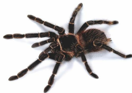
Gambar 1.3 Tarantula Grammostola

Berdasarkan gambar diatas, Exopets menemukan rumah dengan ukuran yang cukup besar dengan harga yang cukup terjamin dan ideal untuk menjalankan bisnisnya. Berikut merupakan contoh dari binatang-binatang yang akan dijual Exopets :