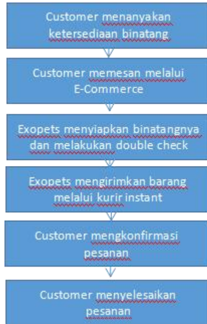
Gambar 5.2 Alur Proses Pemesanan Produk Exopets Secara Online