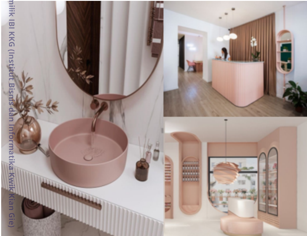
Gambar 2. 8 Contoh Ruang

ingin membawa pasangan ataupun orang lain untuk menunggu Ini juga cocok bagi transgender atau pria yang takut dihakimi oleh sekelilingnya.