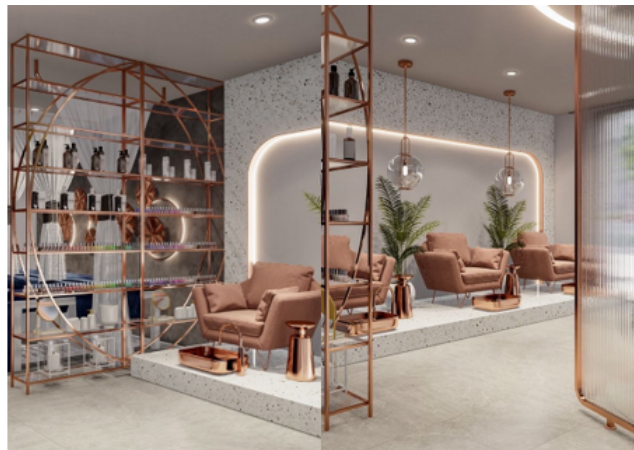
Gambar 2. 3 Contoh Ruangan