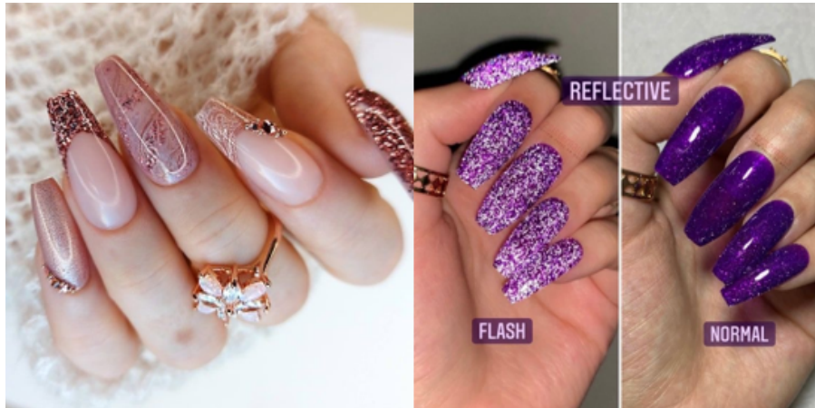
Gambar 2. 2 Contoh Pewarnaan Kuku

makanan dan minuman ringan yang bisa disantap agar tidak bosan sambil menunggu pekerja menyelesaikan tugasnya. Berikut ini pelayanan yang diberikan bersama dengan konsep ruangan yang menunjang kenyamanan konsumen.