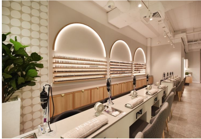
Gambar 2. 4 Contoh Ruangan