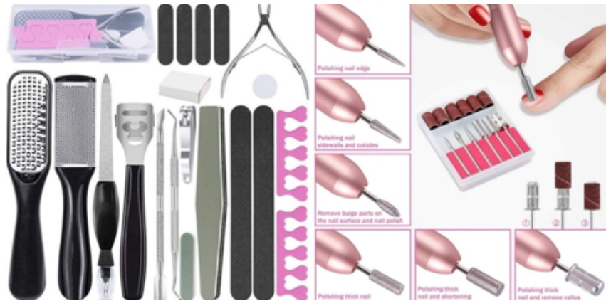
Gambar 2. 5 Contoh Alat

Berikut adalah tampilan dari penempatan kutek serta meja kursi yang akan ada di dalam SPARKLY BEAUTY BAR .