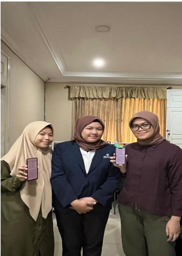
Institut Bisnis dan Informatika Kwik Kian Gie