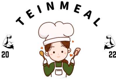
Gambar 1. 2 Logo Usaha Teinmeal