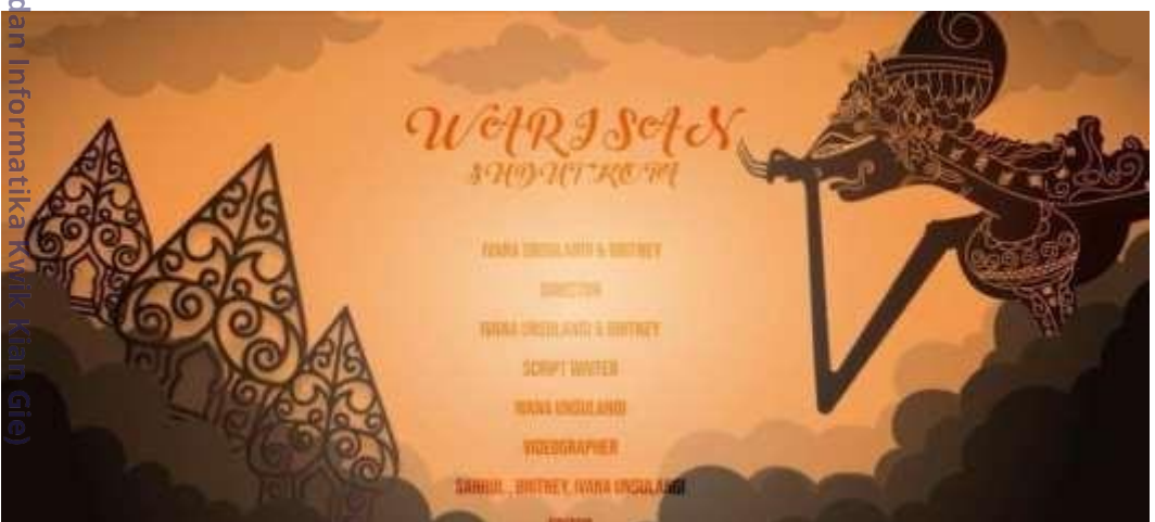
(C) Hak cipta milik IBIKKG (Institut Bisnis dan Informatika Kwik Kian Gie)