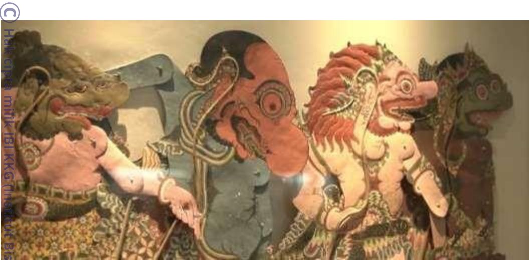
(C) Hak cipta milik IBIKKG (Institut Bisnis dan Informatika Kwik Kian Gie)