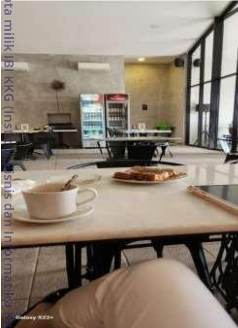
Hak Cipta milik IBI KKG (Institut Bisnis dan Informatika Kwik Kian Gie)

Institut Bisnis dan Informatika Kwik Kian Gie