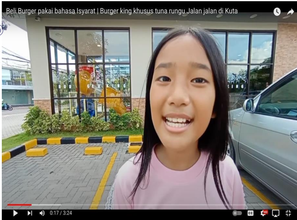
Gambar 2. 4 Burger King Khusus Tunarungu

Pada video yang tertera di atas, kita dapat melihat bagaimana burger king yang berada di pusat kota, dan dimana kota tersebut dikunjungi turis, mereka dengan bijak dalam melakukan kampanye, bahwa burger king peduli dengan kaum tuli, hal ini juga dapat menambahkan poin lebih bagi Indonesia kepada dunia, dimana Indonesia peduli dengan orang-orang tuli yang ada, mereka ingin memperdayakan mereka, sebagai sumber daya manusia yang bermanfaat dan berkualitas, mereka juga menerapkan istilah “ no one left behind ”, tidak ada yang tertinggal.