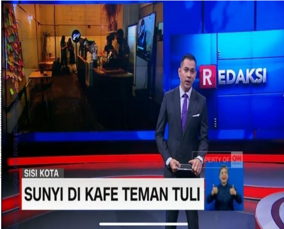
Gambar 2. 2 Video Sunyi di Cafe Teman Tuli

Pada link video tersebut, kita bisa melihat bagaimana café sunyi dapat memperlakukan semua orang yang tidak dapat mendengar dan berbicara, agar mereka dapat mendapatkan hak setara dengan manusia sempurna lainnya, hal ini dapat kita lihat, mulai dari huruf braille yang disediakan, agar dapat memudahkan pekerjaannya dalam melakukan aktivitas dan mobilitas selain itu, kita sebagai manusia yang dapat mendengar dan berbicara.