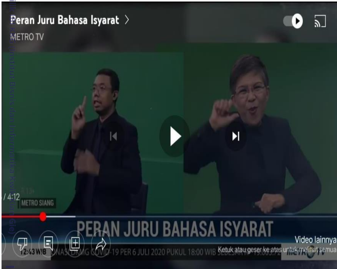
Gambar 2. 5 Video Peran Bahasa Isyarat

teman tuli, dan juga mereka mengajak kita sebagai manusia yang dapat mendengar dan berbicara, agar mengetahui keberadaan mereka, selain itu dapat mengerti sedikit mengenai Bahasa isyarat yang perlu di ketahui, dan secara tidak sengaja para pembuat video atau youtuber tersebut memberikan kita edukasi yang sangat penting bagikita untuk di ketahui dan di pelajari.