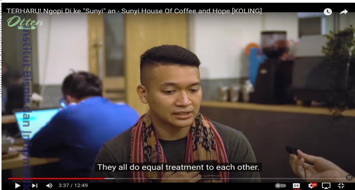
Gambar 2. 1 Video di Channel Youtube Mengenai “Sunyi Cafe”

Coffee Shop yang Bernama kafe sunyi ini merupakan sebuah kafe yang mempekerjakan para kaum teman tuli, sebagai waiter dan barista, kami mengangkat tema kafe sunyi ini sebagai referensi karangan kami, berikut link video referensi kami: