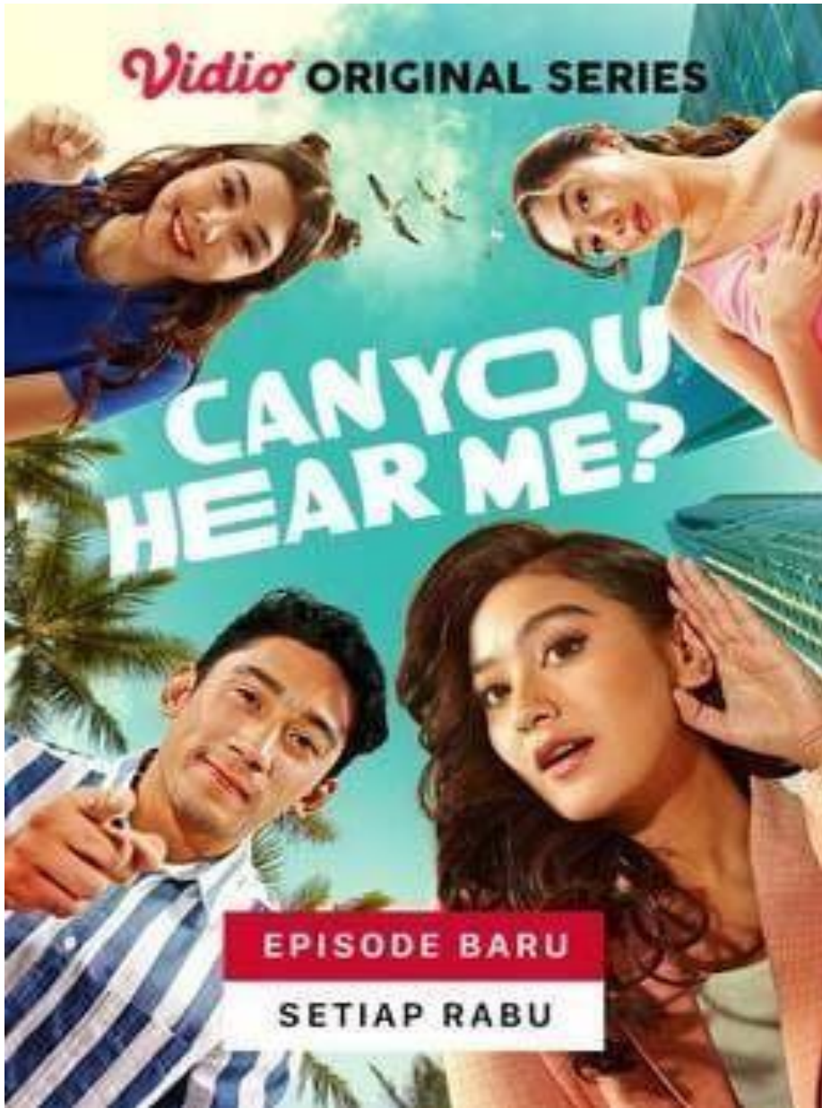
Gambar 2. 7