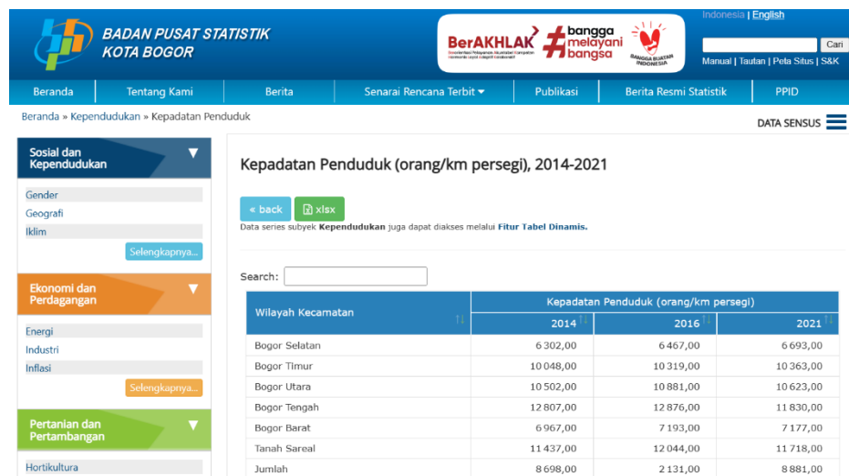
Gambar 1.2 Kepadatan Penduduk Kota Bogor

Umum dan Tata Cara Perpajakan adalah kontribusi wajib kepada negara yang terutang oleh orang pribadi atau badan yang bersifat memaksa berdasarkan undang-undang, dengan tidak mendapatkan imbalan secara langsung karena dipergunakan untuk keperluan negara dan kemakmuran rakyat. Dengan tingginya tingkat penerimaan daerah maka akan menjadi sebuah indikator bahwa perekonomian, termasuk pendapatan masyarakatnya sudah cukup sehingga perekonomian berjalan dengan lancar. Dengan pendapatan asli daerah yang tinggi ini nantinya akan dimanfaatkan untuk keperluan masyarakat juga seperti perbaikan jalanan, peningkatan fasilitas untuk masyarakat dan masih banyak lainnya. Dengan adanya hal-hal tersebut akan membuat daya beli masyarakat akan meningkat. Dengan meningkatkan daya beli masyarakat, maka nantinya akan menjadi peluang tersendiri bagi berkembangnya bisnis ini.