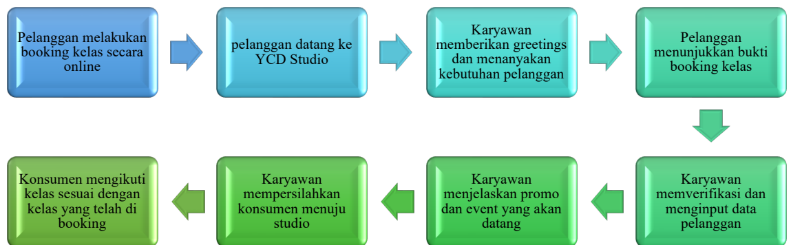
Gambar 5.1 Alur Jasa You Can Dance Studio

YCD Studio memiliki alur bagaimana jasa diberikan dan sampai kepada konsumen. Alur proses pelayanan jasa tersebut digambarkan dalam gambar dibawah ini