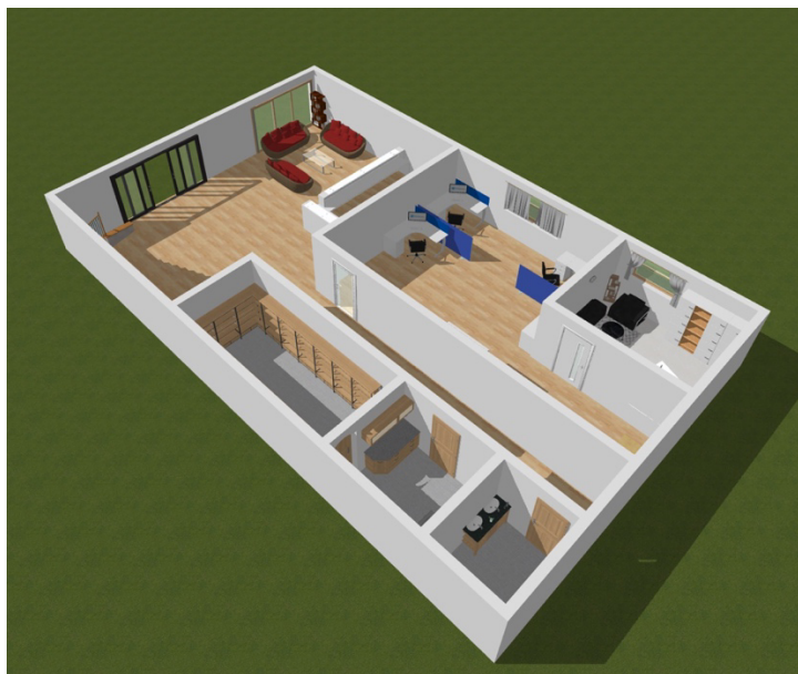
Sumber: You Can Dance Studio

C Hak cipta milik IBI KKG (Institut Bisnis dan Informatika Kwik Kian Gie)