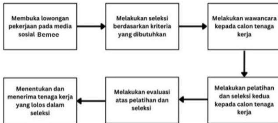
Gambar 1.2 Proses Rekrutmen dan Seleksi Tenaga Kerja

Bemee dalam merekrut tenaga kerja pastinya akan selektif agar tenaga kerja tersebut dapat menjalankan bisnis dan mau mengikuti semua standar operasional dari Bemee serta membantu pemilik untuk mewujudkan visi dan misi Bemee . Berikut ini merupakan proses rekrutmen dan seleksi tenaga kerja yang dilakukan oleh Bemee , yaitu