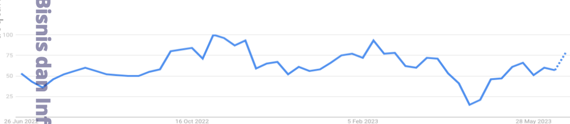
Gambar 1.2 Tren Bola Ubi di Indonesia Pada Juni 2022 - Mei 2023

Usaha kuliner seperti makanan ringan atau cemilan merupakan salah satu usaha yang sedang menjadi trend saat ini karena merupakan usaha yang dapat memenuhi kebutuhan kita. Mulai dari anak-anak, remaja, dewasa hingga lansia, permintaan pasar akan jajanan semakin meningkat. Hal ini menjadikan usaha makanan ringan menjadi salah satu usaha yang diminati banyak orang dan salah satu peluang usaha yang dapat memberikan keuntungan lebih besar. Mondelez internasional merilis survey bertajuk “ The State of Snacking ” yang digelar di 12 negara. Hasilnya, masyarakat Indonesia ternyata paling doyan ngemil. Survei ini dilakukan untuk menganalisa kebiasaan, wawasan dan tren ‘ngemil’ konsumen di Indonesia dan 11 negara lainnya. Dari data di atas penulis melihat besarnya peluang bisnis bola ubi ini sebagai cemilan di Indonesia. Salah satu jenis kuliner atau cemilan yang diminati masyarakat dan memiliki pertumbuhan di Indonesia yang positif adalah bola ubi. Bola ubi diminati masyarakat karena ubi selain memiliki rasa yang enak dan manis namun juga memiliki banyak manfaat. Berikut ini merupakan grafik tren bola ubi pada Juni 2022 – Mei 2023.