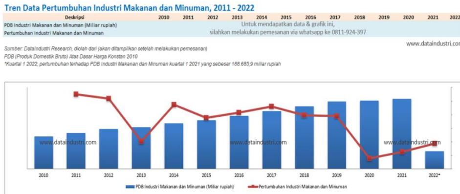
Gambar 1.2 Trend Data pertumbuhan industry makanan dan minuman (per kuartil)

Hak Cipta Dilindungi Undang-Undang 1. Dilarang menyalin sebagian atau seluruh karya tulis ini tanpa mencantumkan dan menyebutkan sumber: a. Pengutipan hanya untuk kepentingan pendidikan, penelitian, penulisan karya ilmiah, penyusunan laporan, penulisan kritik dan tinjauan suatu masalah. b. Pengutipan tidak merugikan kepentingan yang wajar IBIKKG. 2. Dilarang mengumumkan dan memperbanyak sebagian atau seluruh karya tulis ini dalam bentuk apapun tanpa izin IBIKKG.