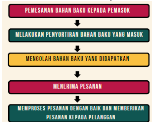
Gambar 5.1 Alur Proses Produksi Mie Ayam IGE