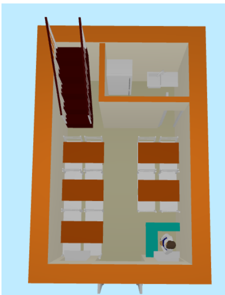
Gambar 5.3 Lay out Bangunan Lantai 1 Mie Ayam IGE